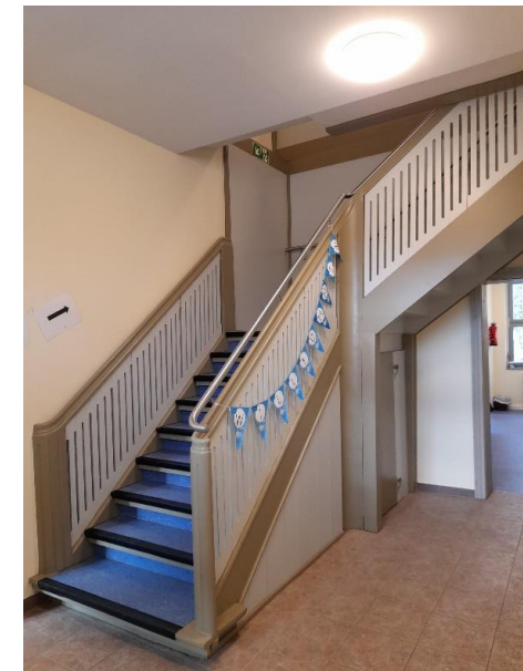
Treppenhaus vorderes Schulgebäude

Die Sanierung und der Umbau der „Kleinen Grundschule auf dem Lande“ wurde weitestgehend abgeschlossen. Im Moment werden die Restarbeiten aus den Abnahmen abgearbeitet.