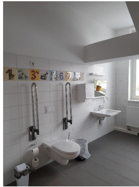
Barrierefreies WC – hinteres Schulgebäude