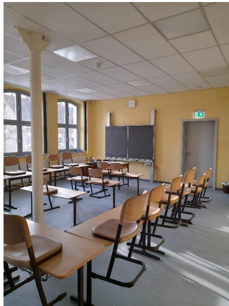
Klassenraum – Kunst vorderes Schulgebäude