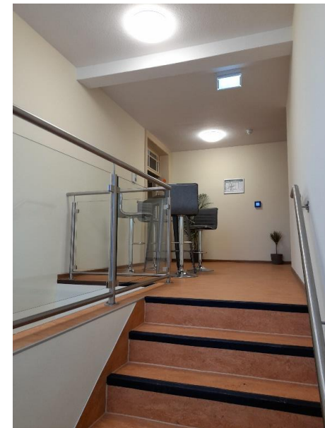
Treppenhaus neu – hinteres Schulgebäude